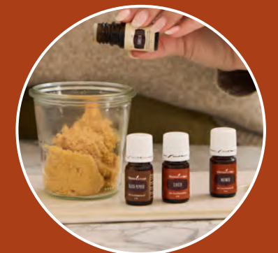
Doe-het- zelfideeën voor de herfst